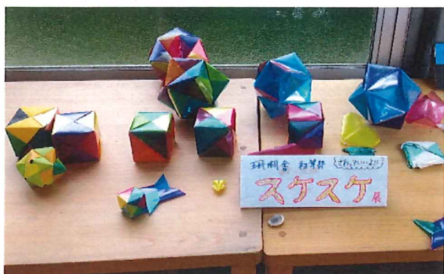
まにまに祭・初等部「数と記号～多面体を折る」

ん庭(後期学習発表会)だからかぜをひかず、改善点もなおしながら、がんばりたいです。